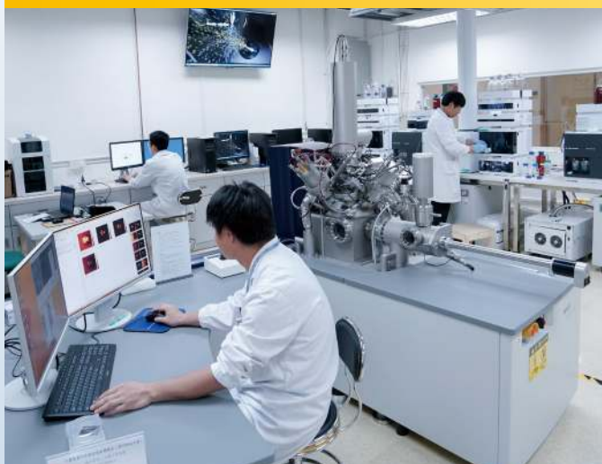
▼ 中藥質量研究國家重點實驗室

大學也特別注重發展特色與優勢研究領域、推動科研成果轉化，如中藥質量與創新藥物、月球與行星科學、癌症與風濕病治療、系統工程、環境科學、智慧城市、建築與城市規劃、人力資源與博彩旅遊管理、澳門歷史、澳門社會文化與可持續發展研究、海峽兩岸暨港澳地區區域法律比較、藝術設計、傳播、知識產權保護、海洋保護與開發利用、下一代互聯網、智能機器人技術創新、數學、澳門知識產權服務等，為地區的持續發展和經濟適度多元發展做出貢獻。