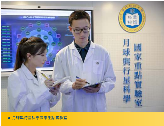
▲ 月球與行星科學國家重點實驗室