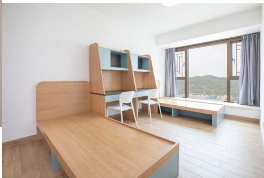
部份宿舍單位照片(僅供參考)