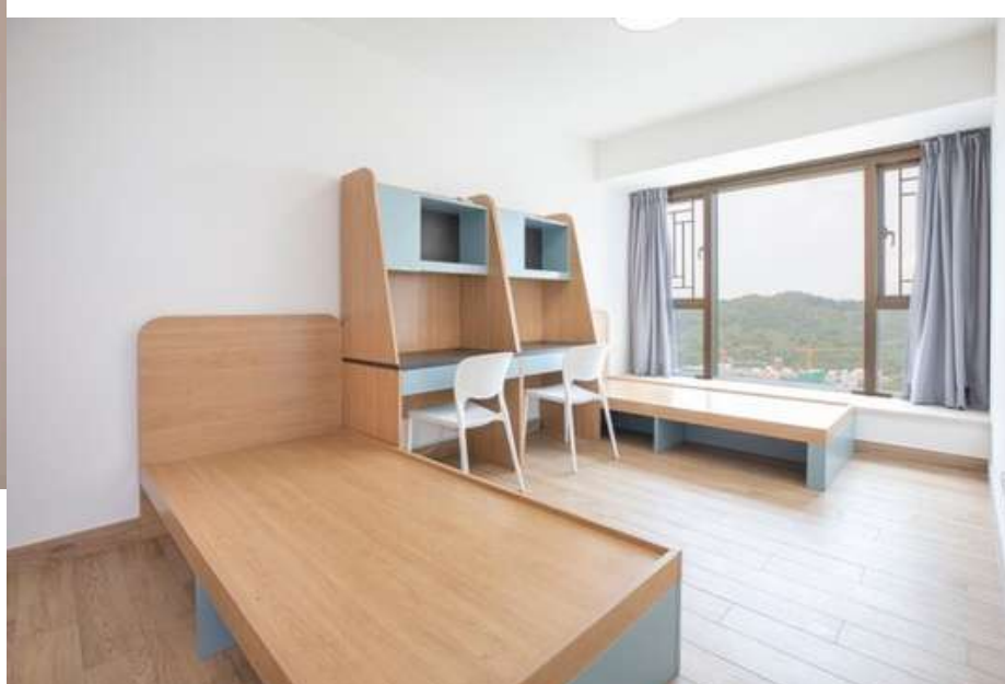
部份宿舍單位照片(僅供參考)